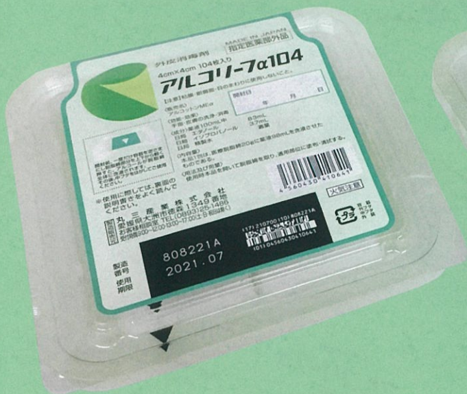
4cm × 4cm 104枚入り