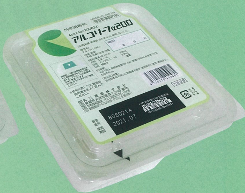
4cm × 4cm 200枚入り